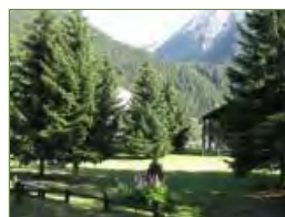
I prati e pini "falciati" dalla Strada di penetrazione