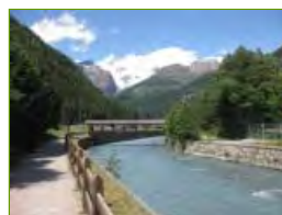
L'area dove passerebbe la Strada di penetrazione e dove verrebbe costruito il garage multipiano