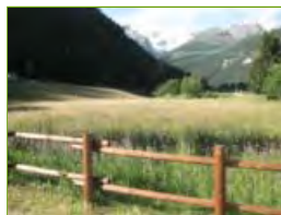
L'area dove passerebbe la Strada di penetrazione e dove verrebbe costruito il garage multipiano

Alcune immagini della bella Champoluc i cui verdi prati, per il Comune di Ayas, sono destinati a sparire per sempre per costruirvi al loro posto una lunga lingua d'asfalto.