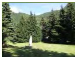
I prati e pini "falciati" dalla Strada di penetrazione