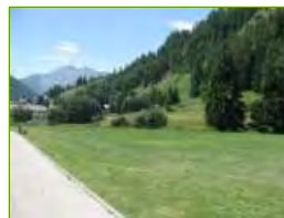
L'area dove passerebbe la Strada di penetrazione e dove verrebbe costruito il garage multipiano