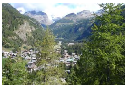
Veduta di Champoluc lungo il sentiero per Mascognaz