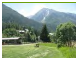
L'area dove passerebbe la Strada di penetrazione e dove verrebbe costruito il garage multipiano