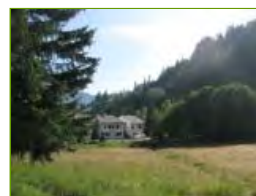
L'area dove passerebbe la Strada di penetrazione e dove verrebbe costruito il garage multipiano