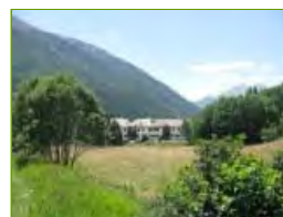
I prati e pini "falciati" dalla Strada di penetrazione

Visualizza tutte le fotografie di Champoluc